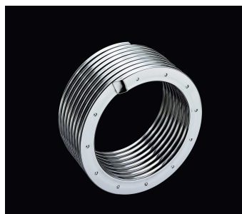
Tepelný výměník Inox-Radial z ušlechtilé nerezové oceli